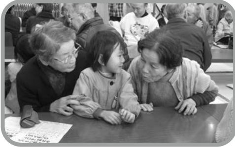
▲「おばあちゃん、あのね・・・」