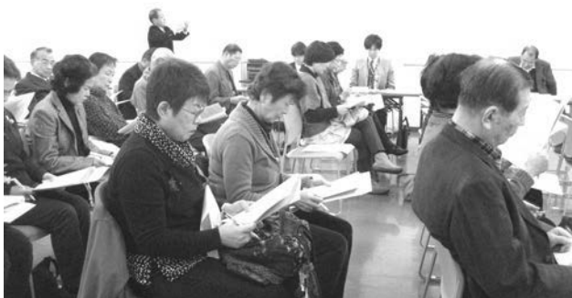
▲設立総会に参加された皆さん