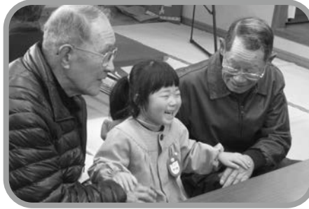
▲おじいちゃんといっしょ