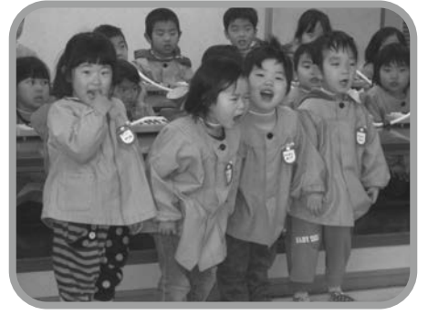
▲元気いっぱいの発表♪♪

2月28日(木)小屋浦集会所で、「第123回こやうらふれあいサロン」を開催しました。小屋浦保育所児の皆さんを迎え、鍵盤ハーモニカ・歌の発表とお話タイム、肩たたきなどで、元気をもらい楽しい時間を過ごしました。