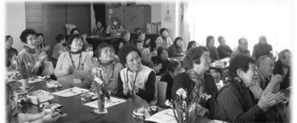
▲テーブルには生花が飾られ、和やかな雰囲気に参加者