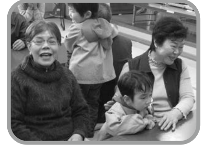
▲「保育所に帰りたくないよ。」