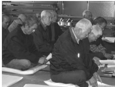
▲熱心に話を聞く参加者