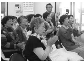
▲レイをかけ気分はフラダンサー