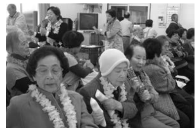
▲玄米ダンベル体操