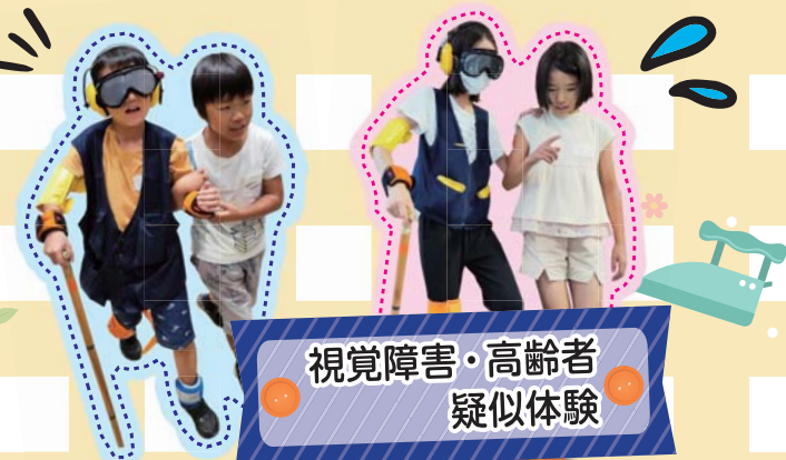
視覚障害・高齢者疑似体験