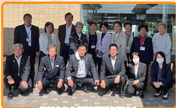
参加された福祉委員の皆さん