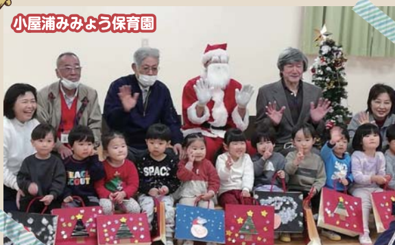
小屋みみょう保育園