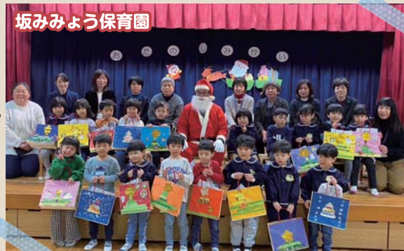
坂みみょう保育園