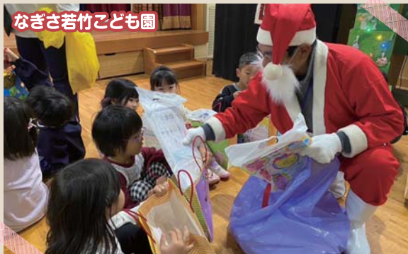
なぎさ若竹こども園