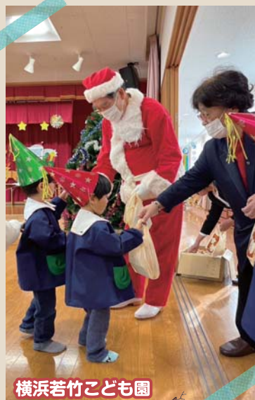
横浜若竹こども園

昨年12月21日(木)、民生委員児童委員さんのお手伝いのもと、町内4保育園で、「お楽しみ会」を行いました。子ども達はサンタさんからのプレゼントに大喜び♪今回は地域の方々も参加され、一緒に歌ったり、踊ったりして楽しい時を過ごしました。