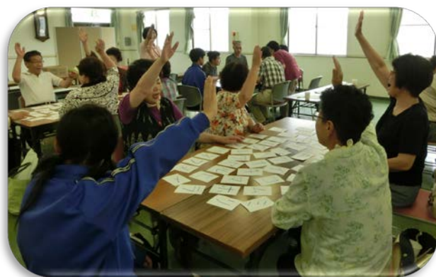
楽しそうに研修を受けられたみなさん♪