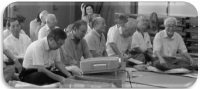
熱心に話を聴かれる“サロン西側”に参加されたみなさん