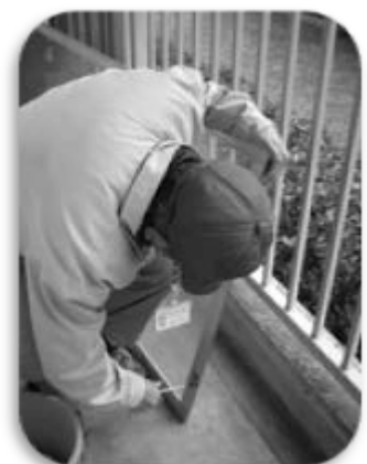
網戸の張り替えをされている ボランティアさんの様子