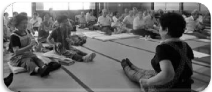
座ったままできる “水戸黄門体操”の様子