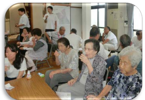
できあがった「補水液」で「カンパ〜イ!」