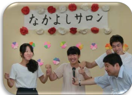
学生と楽しくゲーム♪