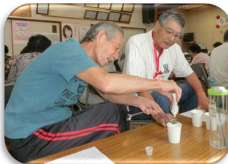
「経口補水液」を作る参加者