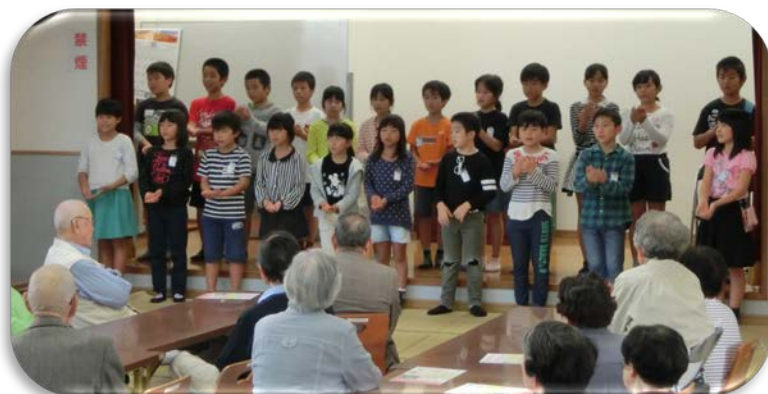
素晴らしい歌声♪にうっとり

サロンでは、いろいろな催しや取り組みが行われていますが、多世代交流ができることも、サロンの魅力ではないでしょうか。